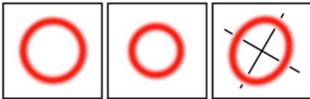
Abb. 1: Schematische Darstellung des Detektorbildes im Canon Autoref RK-F1. Bei einem emmetropen Auge „sieht“ die Kamera einen kreisförmigen unscharfen Lichttring. Sein Durchmesser dient als „Referenzdurchmesser“. Bei einer sphärischen Ametropie hat der Kreis einen größeren oder kleineren Durchmesser. Bei einer astigmatischen Fehlsichtigkeit verformt sich der Lichttring zu einer Ellipse.

Autorefraktometer gibt es seit 40 Jahren. Das Dioptron Ultima hatte schon 1979 eine hohe Messgenauigkeit. Das Humphrey HAR 510 maß die Fehlsichtigkeit bereits 1980 unter Berücksichtigung der Aberrationen höherer Ordnung. Ab 1985 stellten japanische Firmen sehr schnelle Messverfahren vor, bei denen das Netzhautbild nicht mehr scharfgestellt wurde (Abb.1, Wesemann, 2004a). Ab 2000 konnte man Wellenfrontaberrometer für die Laserchirurgie erwerben. Seit 2006 gibt es nun auch Wellenfrontaberrometer für augenoptische Anwendungen.