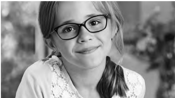
Fortbildungspunkte: Zentralverband der Augenoptiker: 2 Punkte

Diese und viele weitere Aspekte werden im 48. Fielmann Akademie Kolloquium in gewohnt fundierter und verständlicher Weise diskutiert.